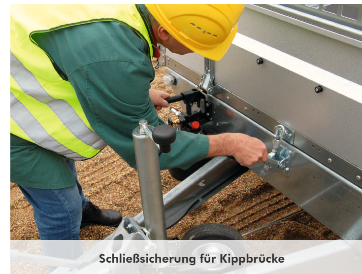
Schließesicherung für Kippbrücke