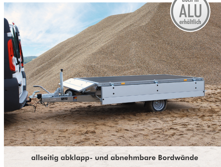
allseitig abklapp- und abnehmbare Bordwände