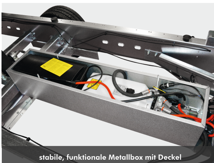
stabile, funktionale Metallbox mit Deckel