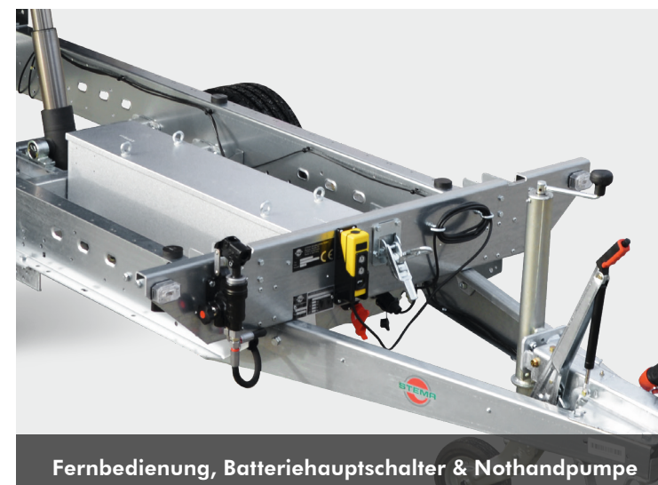
Fernbedienung, Batterie Hauptschalter & Nothandpumpe