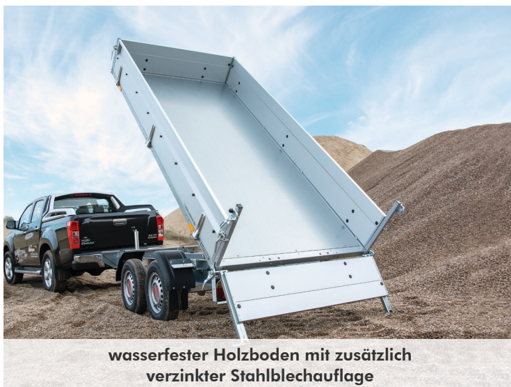
wasserfester Holzboden mit zusätzlich verzinkter Stahlblechauflage

Die Kippbrücke wird mit einer zusätzlichen Schließesicherung einfach arretiert. Der im Fahrgestell integrierte Schienenhalter (optional) mit abschließbarem Fach sorgt die ganze Fahrt über für einen sicheren und ruhigen Transport. Die passenden ALU-Auffahrampen sind über die gesamte Ladebreite individuell verschiebbar und als Zubehör erhältlich.