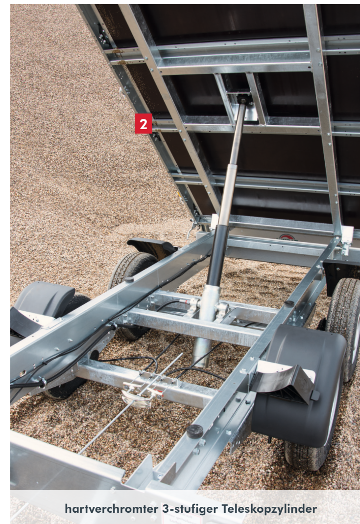
hartverchromter 3-stufiger Teleskopzylinder