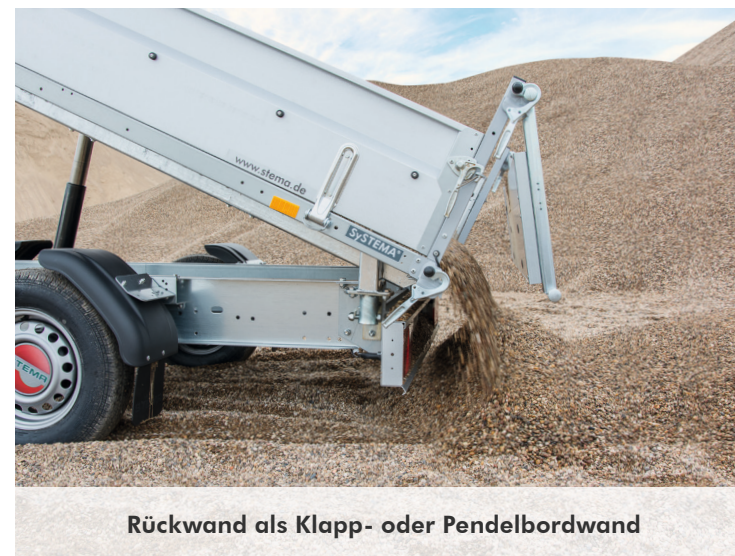
Rückwand als Klapp- oder Pendelbordwand